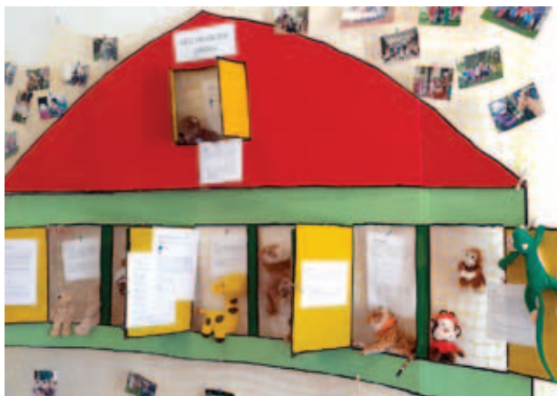
Výstava 25 let