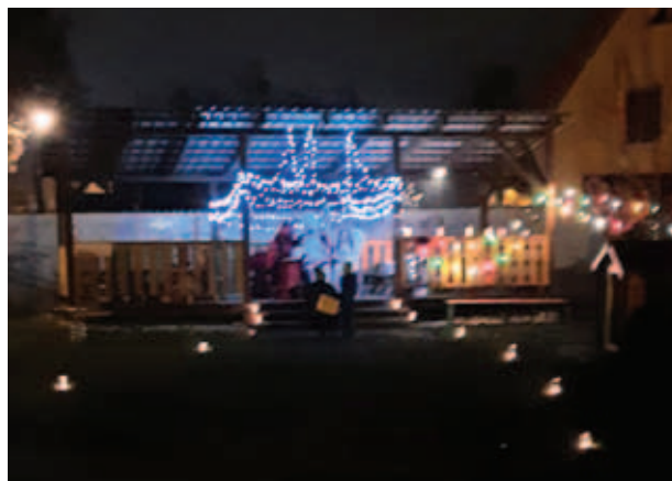
Cesta za Mikulášem