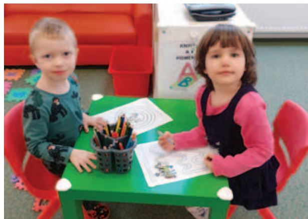
Mateřská škola Brandýský Matýsek