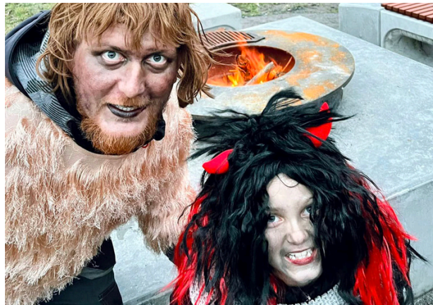
Cesta za Mikulášem