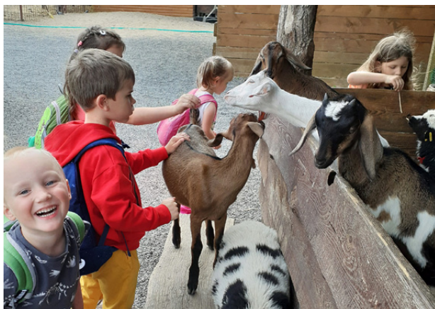
Mateřská škola Brandýský Matýsek