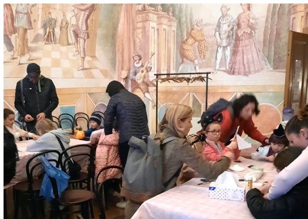
Halloween na zámku