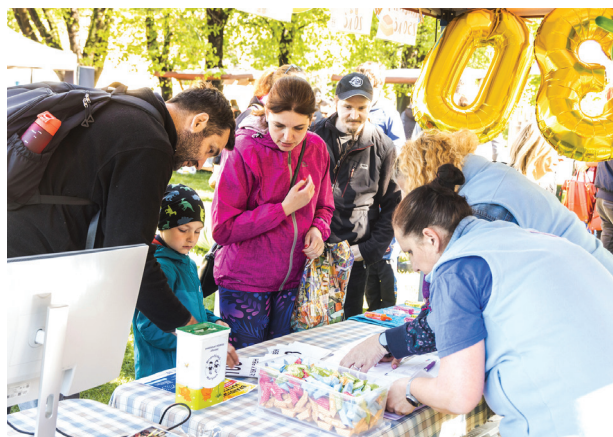
Dětský běh a oslavy 30. výročí