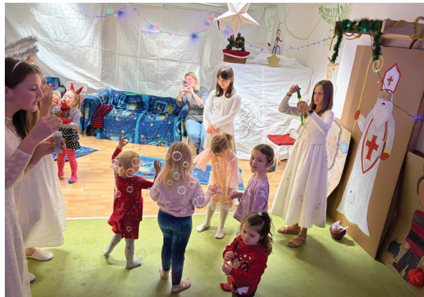
Cesta za Mikulášem