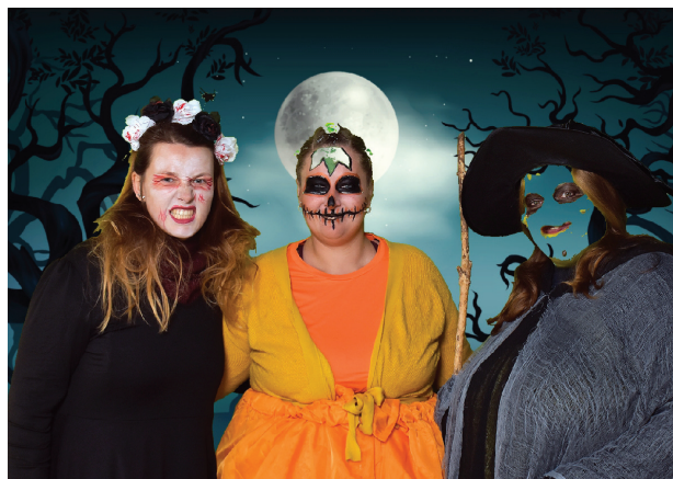
Halloween na zámku