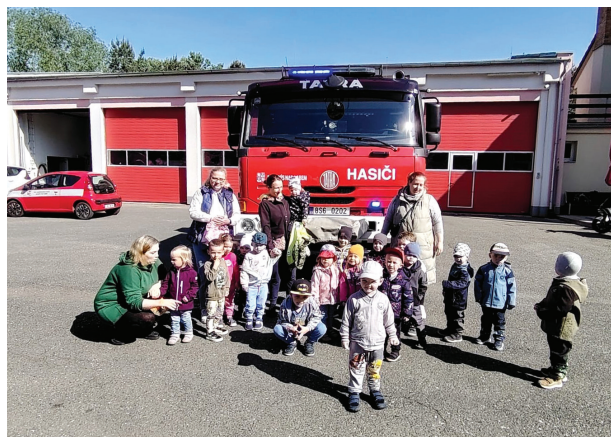
Matýskův dětský klub