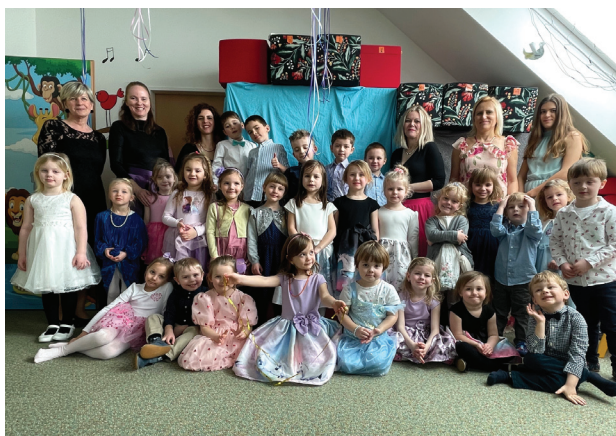
Mateřská škola Brandýský Matýsek