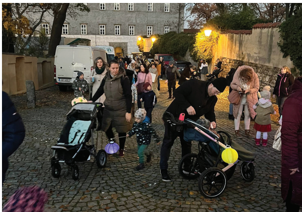
Svatomartinský lampiónový průvod